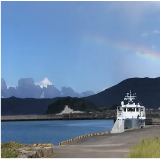
与路港からの眺め